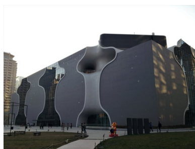
台中の国家オペラハウス